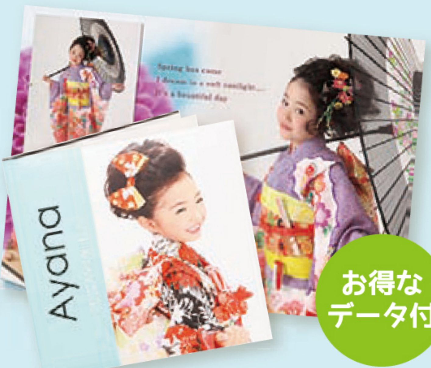
デジタルアルバム 6P 定価 28,600円 (税別) 12P 定価 59,600円 (税別)