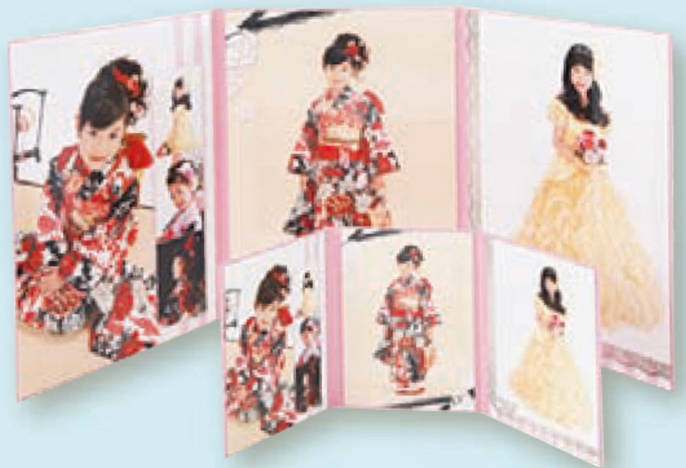
フェリーチェ 定価 26,600円 (税別)

専属デザイナーが一点一点お客様に合ったデザインで制作いたします。 大切な記念を一生の記録として残しませんか?