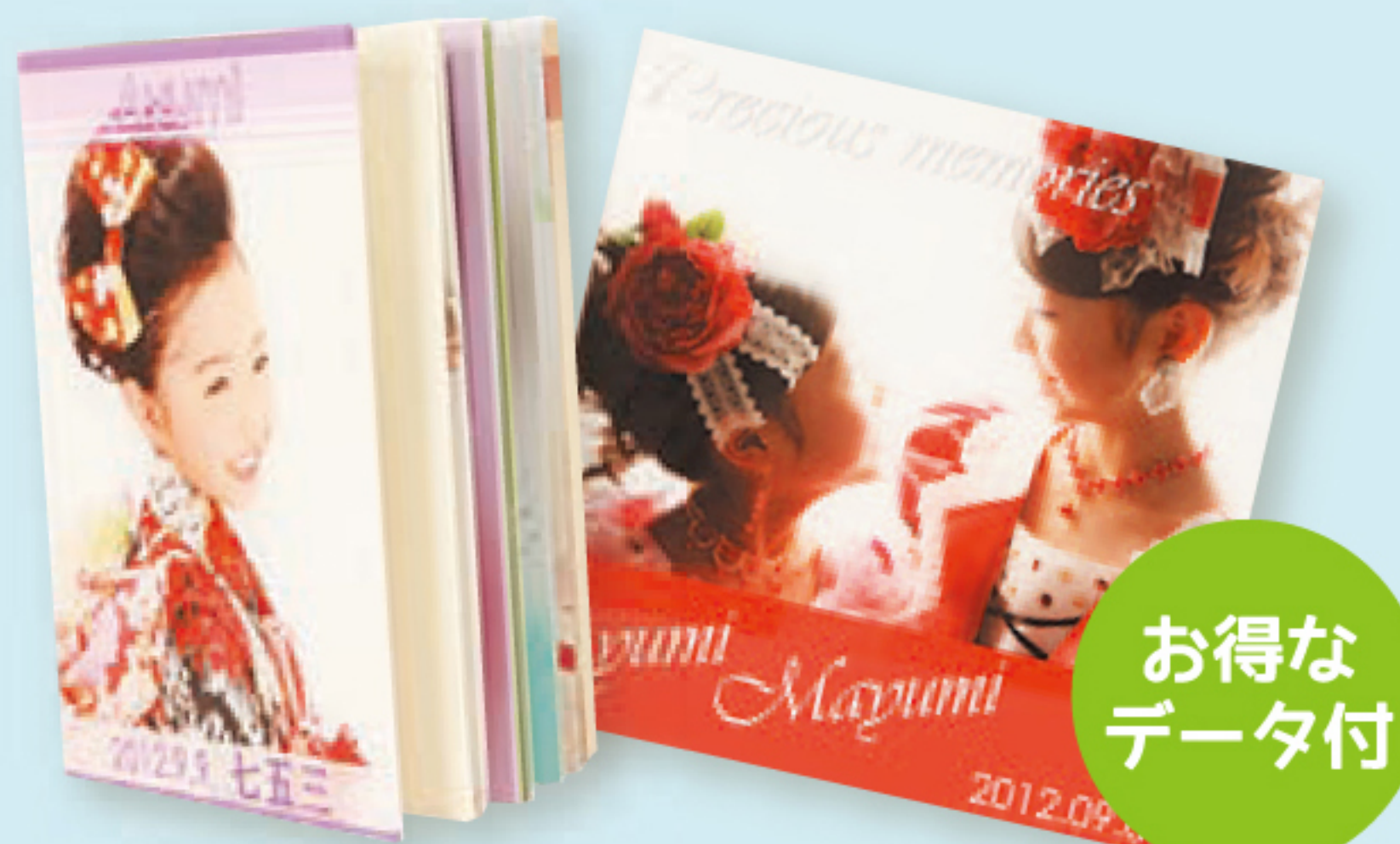
デジタルアルバム 6P・8P・12P アクリルシリーズ 定価 34,600円 (税別)