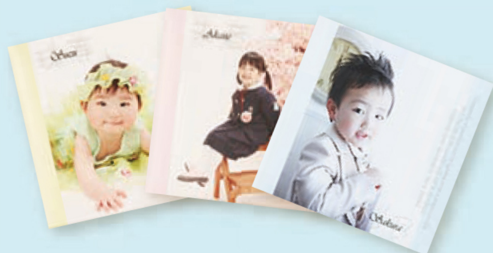
デザイン台紙 定価 18,600円 (税別)